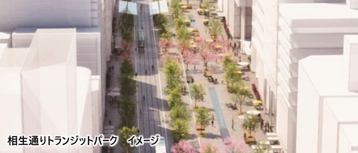
相生通りトランジットパーク イメージ